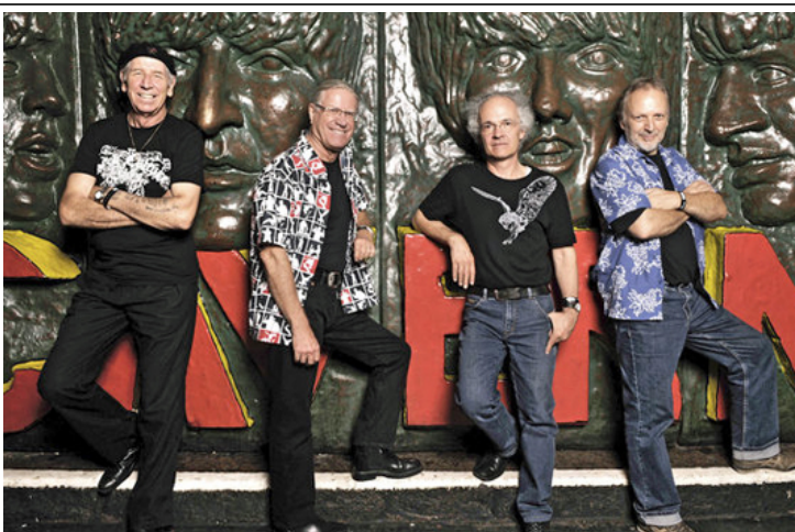
Les Sauterelles – die legendäre Beatband der Sixties.

Am 19. September 1962 begannen die Geburtswehen dieser heute legendären Band. Zwei Studenten aus der französischen Schweiz, die in Zürich studierten, gründeten zusammen mit Toni Vescoli, dem kleinen «Elvis», die legendäre Rockgruppe Les Sauterelles. Sie hatten sich der Musik der Shadows verschrieben.